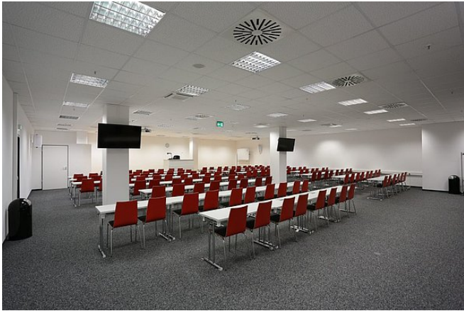
Raum: N/FOM H1